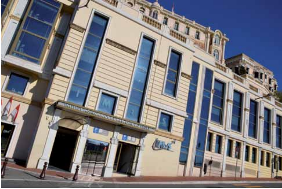
Monaco Institute of Sports Medicine and Surgery