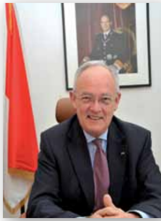
S.E. M. LE MINISTRE D'ETAT MICHEL ROGER H.E. THE MINISTER OF STATE MICHEL ROGER