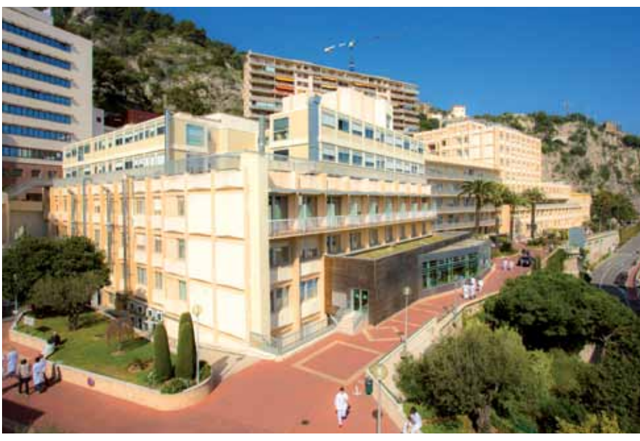
Princess Grace Hospital