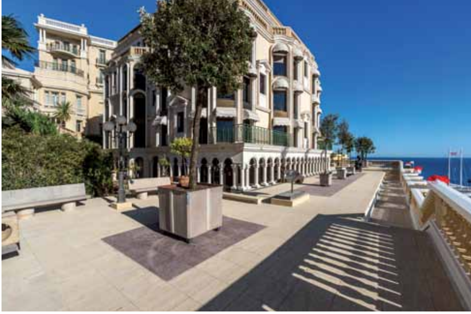
Monaco Cardiothoracic Centre